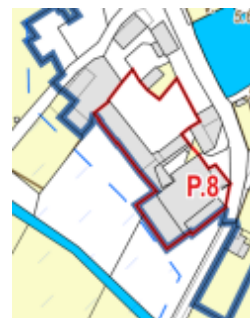
Plocha P.8 v návrhu výkresu předpokládaných záborů půdního fondu

Krajský úřad k této ploše uvádí následující: V tomto konkrétním případě se jedná o změnu funkčního využití přestavbové plochy (z BV – bydlení venkovské na SC - smíšené obytné centrální). Nejedná se o nový zábor ZPF. Vyhodnocení záboru ZPF bylo již předmětem posuzování pro stávající funkční využití, mimo to se jedná o ZPF o výměře 36 m 2 v zastavěném území, které je pouze součástí celé přestavbové plochy P.8. Krajský úřad konstatuje, že návrh plochy P.8 nadále splňuje zásady plošné ochrany uvedené v § 4 zákona. Na základě výše uvedeného krajský úřad s plochou P.8 souhlasí.